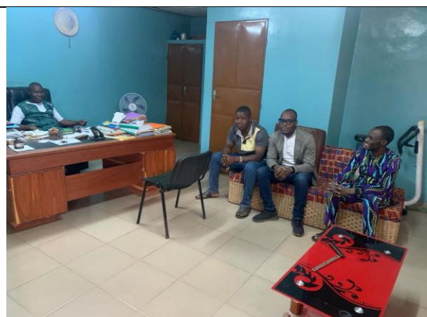
Entretiens avec l'équipe de Espérance 2001 à Djougou