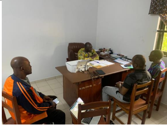
Entretiens avec le Directeur Général de l'ONG ERAD