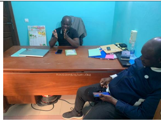
Échanges à la Direction départementale de l'Eau Zou Colline