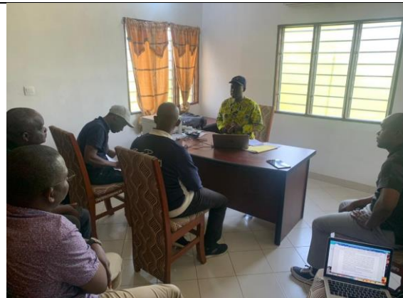
Entretiens au projet PADIAP