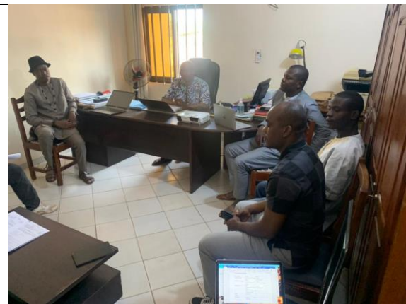
Entretiens au GIC