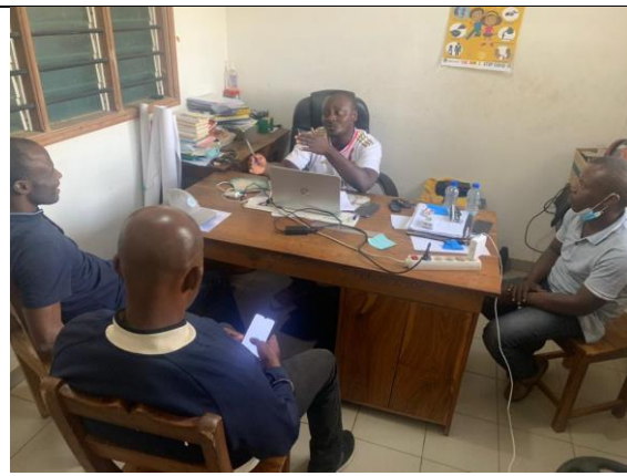
Entretiens à l'ONG Racines