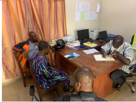
Echanges à la mairie de Natitingou