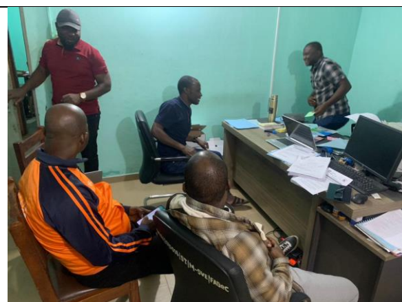
Entretiens à la mairie de Savè